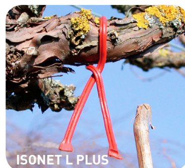
ISONET L PLUS