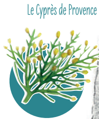
Le Cyprès de Provence

Composé d'arbres de hauts jets (A) et d'arbustes (B) de hautes et moyennes tailles, cet alignement permet d'allier paysage et fonctionnalité pour la faune. Sa faible emprise par rapport à une haie autorise son implantation en tête de rang, au fond de la tournière ou en bord de parcelle.