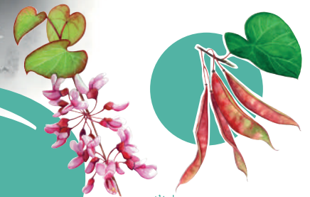
L'Arbre de Judée

Érable de Montpellier, Amandier, Poirier à feuille d'amandier, Arbre de Judée