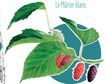
Le Mûrier blanc