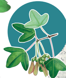
L'Érable de Montpellier