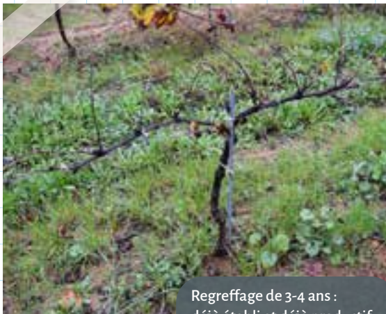
Regreffage de 3-4 ans : déjà établi et déjà productif.