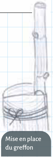
Mise en place du greffon

9 Au fil de la pousse, sélectionner le plus beau rameau et l'attacher. Ébourgeonner le reste. Dans la mesure du possible, conserver le rameau situé dans le flux de sève qui est normalement celui du bas, situé sur l'extérieur. Le greffon est fragile les premières années : attention au travail du sol. On peut sécuriser l'installation en installant un double tuteur, avec un attachage soigné. Le système racinaire de la vigne étant déjà en place, il n'est en général pas nécessaire d'arroser les plants greffés. ●