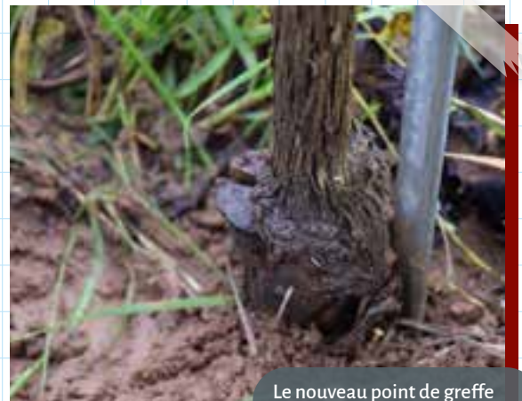
Le nouveau point de greffe après 3-4 ans, productif.