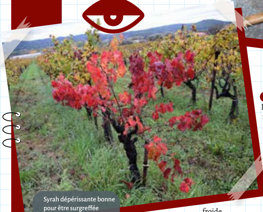
Syrah dépérissante bonne pour être surgreffée