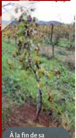
À la fin de sa première saison, la greffe a souvent produit suffisamment de bois pour permettre l'établissement du tronc, parfois d'un bras ou des deux...