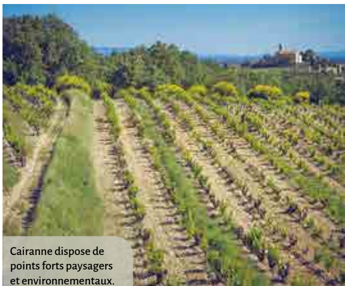
Cairanne dispose de points forts paysagers et environnementaux.