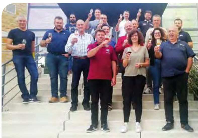
Les présidents des Syndicats de Côtes du Rhône Villages s'unissent pour développer un programme d'actions de communication.

Le Syndicat va également continuer à participer à des opérations d'image avec les Crus des Côtes du Rhône.